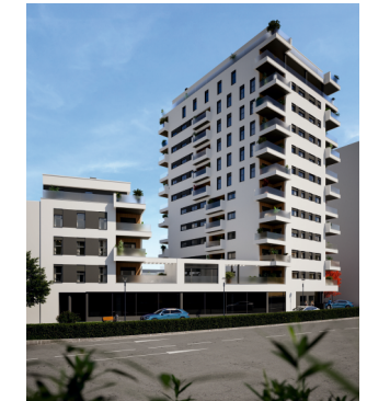
C/ Sanz Crespo - Gijón