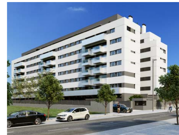
C/ de la Ilusión, 52 - El Cañaveral, Madrid