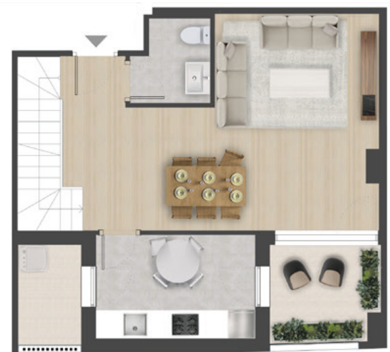
PLANTA DE ACCESO