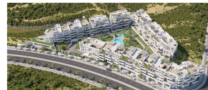
Colinas del Limonar - Málaga