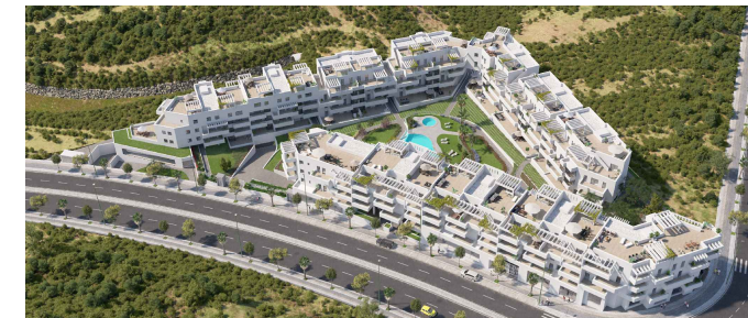
Colinas del Limonar - Málaga