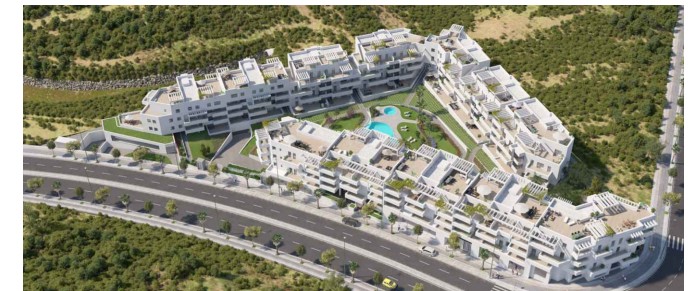
Colinas del Limonar - Málaga