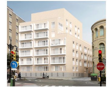
C/ Ramón y Cajal, 2 - Zaragoza