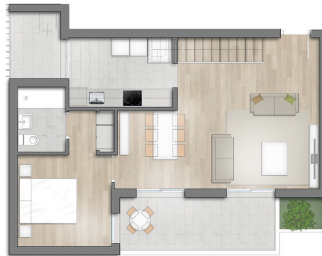
PLANTA DE ACCESO

Un hogar especial, con dos plantas, terraza y solárium.