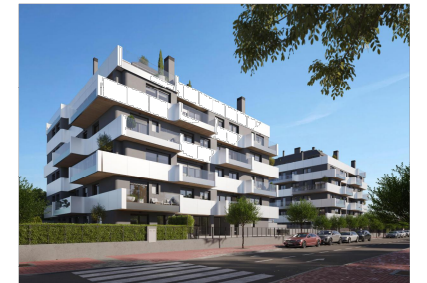
La nueva Flota - Murcia